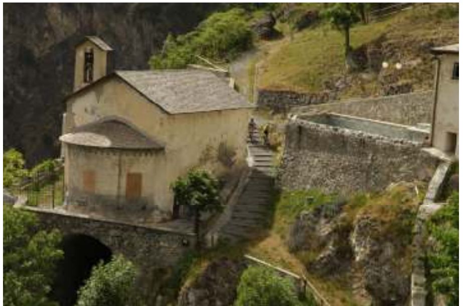
In Bormios Thermen erholen sich schon die Römer von Altarezia Up & Down!

das 1 x 1 des Kurvenfahrens und die richtige Blickführung.